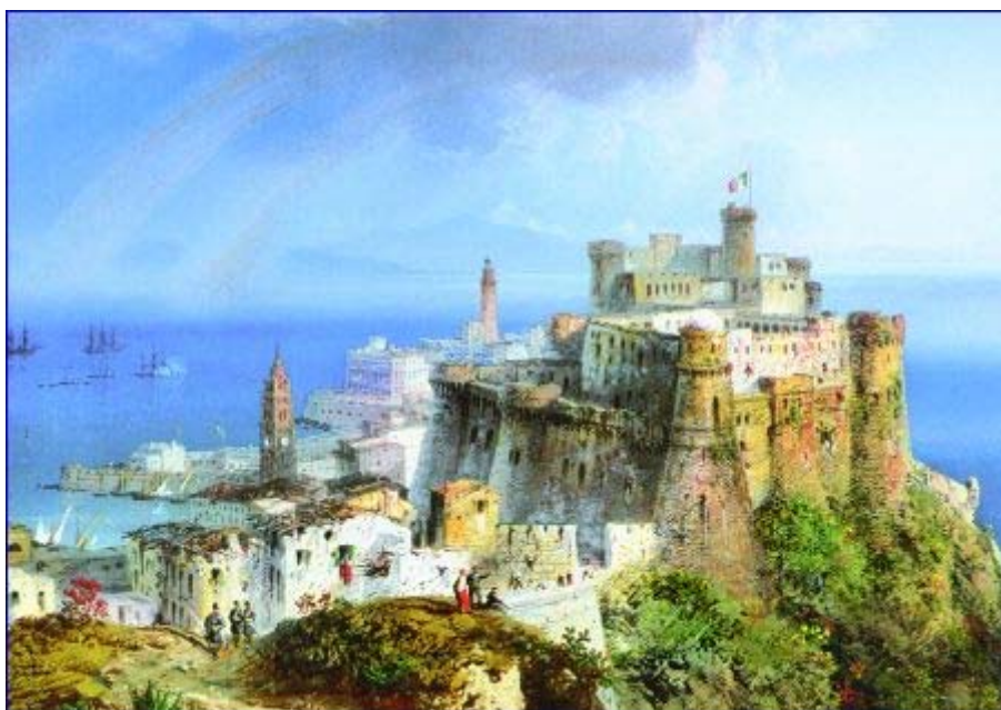
Assedio di Gaeta, tempera di Carlo Bossoli

:: 150° Anniversario dell'Unità d'Italia ::